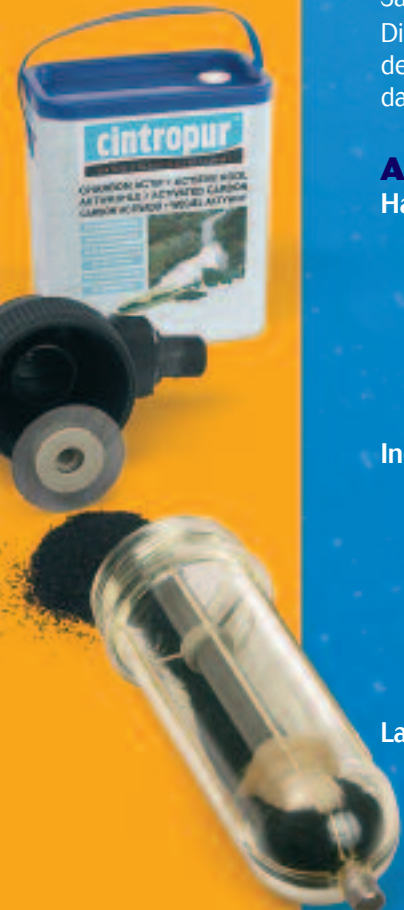
NW 25 TE + Aktivkohle

Die hohe Anzahl der Poren und die große Kontaktfläche machen unsere Aktivkohle zu einer exzellenten Wahl für die Verbesserung des Geschmacks, das Entfernen von Gerüchen, das Vermindern des Chlorgehaltes, des Ozons und der Verunreinigungen wie Pestizide und andere organischen im Wasser befindlichen Substanzen.