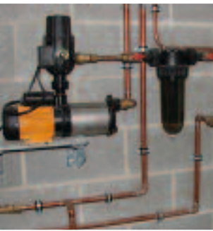
NW 18 Ø 3/4"